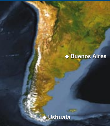
◆ Buenos Aires

Este es el viaje ideal al Gran Continente Blanco. Con salida y regreso desde Ushuaia, incluye los atractivos más espectaculares de las Islas Shetland del Sur y la Península Antártica. La expedición se orienta hacia la observación de la vida silvestre, enmarcada en el impresionante escenario formado por estrechos canales, glaciares, icebergs y montañas escabrosas.